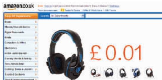
亚马逊商品标价让很多人不敢相信自己的眼睛 制图 沈明

据国外媒体报道,亚马逊网站日前再闹乌龙事件,一些英国零售商发现,他们在亚马逊网站上的商品竟然以0.01英镑的标价进行售卖。这并非亚马逊想赶走某个顽固的图书商家或是尿布生产商,相反,这些商家是由于使用了亚马逊网站上的Repricer Express功能,这项功能出现故障导致这些商家的商品标价全都成了0.01英镑。