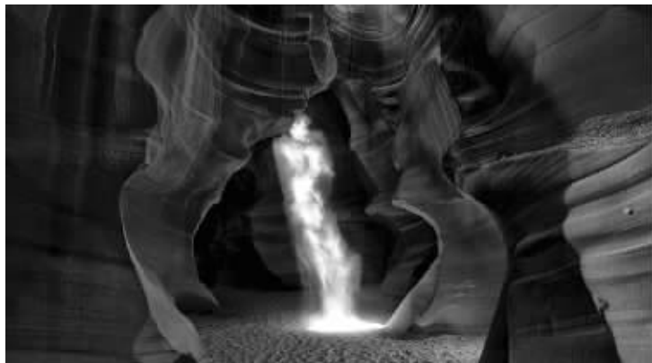
评论家乔纳森·琼斯称这张650万美元的照片“看起来就是高档酒店里悬挂的庸俗海报”

出生于澳大利亚,工作于美国的摄影家彼得·力克日前在自己网站上宣布,自己的一张风景摄影作品以650万美元成交,成为全世界最昂贵的摄影作品。然而,这张作品的艺术性却受到广泛质疑,有评论家表示购买者“人傻钱多”。