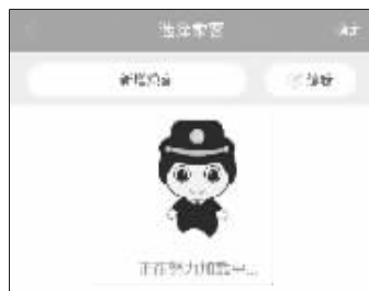
票卖光了,抢票软件还在加载