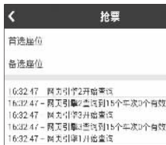
抢票软件始终抢不到票

下午4点半一到,“智行火车票”还在不断地刷新,而12306网站显示K1354次还有余票。5分钟后,12306网站上的余票被抢光,而“智行火车票”始终没抢到票。