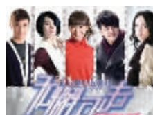
《无懈可击之美女如云》

上映时间: 2014年11月 取景地: 五台山某盲人推拿店、玄武湖、南京人口管理干部学院等