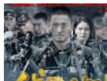
《我是特种兵·国之利刃》

上映时间: 2012年 取景地: 南理工、南师大、河海、南京体育学院、弘阳广场、夫子庙、中央门等