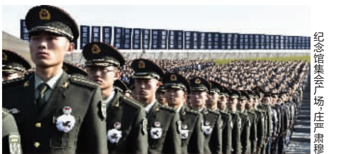
除警名图片均为新华社发 各界代表佩戴白花 肃静肃立