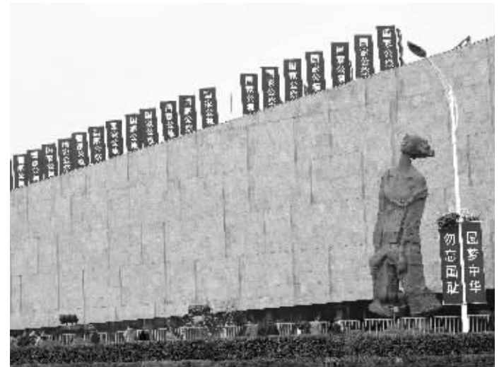
近日,侵华日军南京大屠杀遇难同胞纪念馆建筑及周边道路上布置了国家公祭日主题标语牌

明年是世界反法西斯战争胜利暨中国人民抗日战争胜利70周年。侵华日军南京大屠杀史学会副会长张生表示,在当前世界兴起反思战争、珍爱和平的热潮中,我国高规格举行国家公祭,也在向国际社会传递和平理念,经历了苦痛灾难的中华民族比以往任何时候都祈望和平。