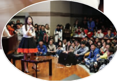
蒋方舟在南航演讲

其次,特殊的人生经历,让她有更加独立的思考,而不是沉浸于生活的烦恼或荣耀之中。蒋方舟曾经去南师大举办讲座,表达了一些鼓励,一位大二女生站起来,说蒋方舟是站着说话不腰疼。蒋方舟告诉记者,她很感谢那个女孩子,因为“人生的每一个阶段都需要一些人去提醒你,你走得偏了,或者是你走得得意忘形了”。