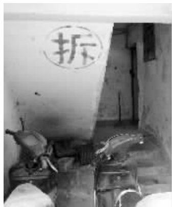
待拆楼房的楼道里写着“拆”字

今年划到了鼓楼区滨江商务区管委会。此前街道等曾经对公共路2号清理过一次,把租户清走了,并且要求工程队不得再将空房出租。由于目前归属鼓楼区滨江商务区,记者将此情况向商务区管委会反映,对方表示将派人进行清理。