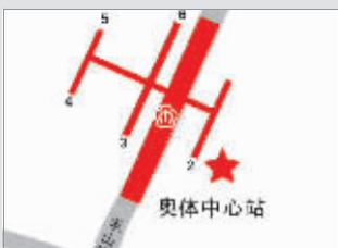
奥体中心地铁站 自行车站点在2号出口