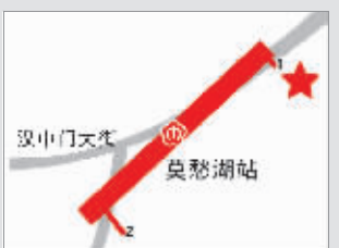
莫愁湖地铁站 自行车站点在1号出口