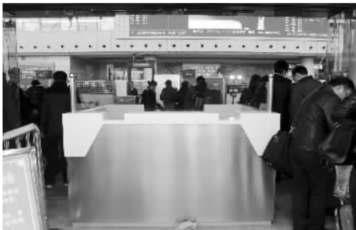
实名制验票口近期将投入使用

南京站的工作人员表示,建设实名制验票口主要是方便乘客,“有了这个玻璃验票空间,排队的乘客可以少吹点风,少挨点儿冻。”