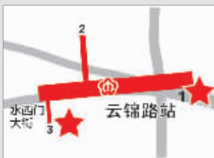
云锦路地铁站 自行车站点在1、3号出口