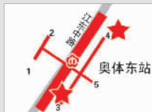
奥体东地铁站 自行车站点在3、4号出口