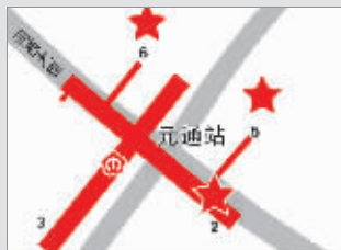
元通地铁站 自行车站点在2、5、6号出口