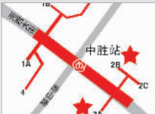
中胜地铁站 自行车站点在2A、2B出口