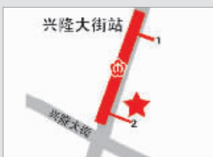
兴隆大街地铁站 自行车站点在2号出口