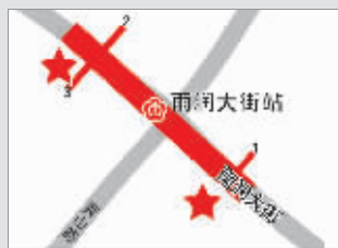
雨润大街地铁站 自行车站点在3号出口及1号出口的反方向

快报讯(记者 赵丹丹)目前,河西加上鼓楼区的公共自行车点一共是250个,不少市民想知道,哪些地铁站出口才有公共自行车。昨天,河西公共自行车事业部晒出了地铁站找自行车“宝典”,看了这些图,你就知道河西地铁站哪些出口能借自行车了。