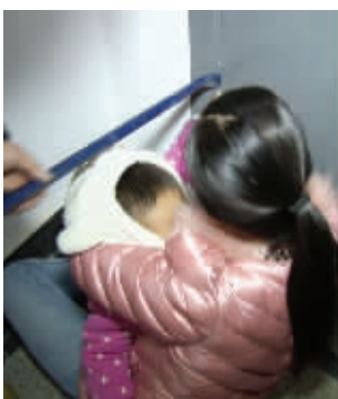
消防队员施救

快报讯(记者 孙玉春)昨天上午10点左右,在六合大厂街道兰亭苑小区,一名一岁半的小姑娘,不慎被楼道安全门夹住手,多亏消防队员紧急施救。