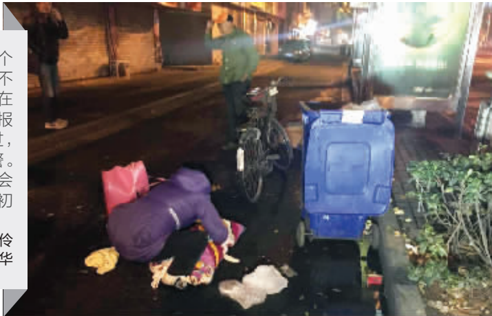
在这里发现了女婴