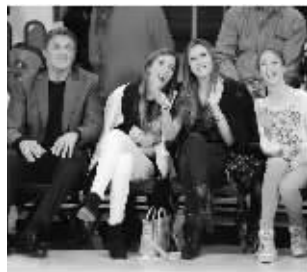
史泰龙携三位女儿看湖人比赛