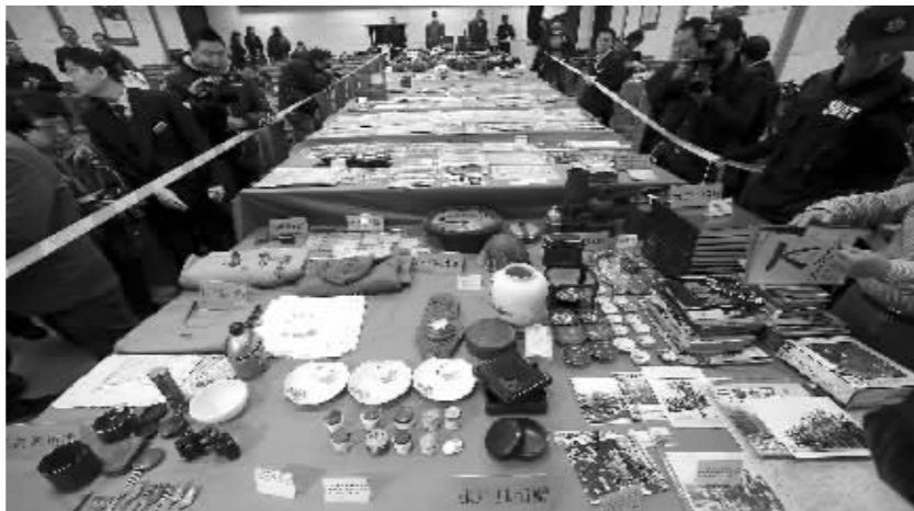
报告厅内, 长18米、宽12.5米的厅内摆满新征文物史料

朱成山指出, 这些文物史料的来源渠道超过以往, 涉及国家多达14个。截至目前, 纪念馆在世界范围内共征集各类藏品15.8万余件, 其中文物达3.2万余件。