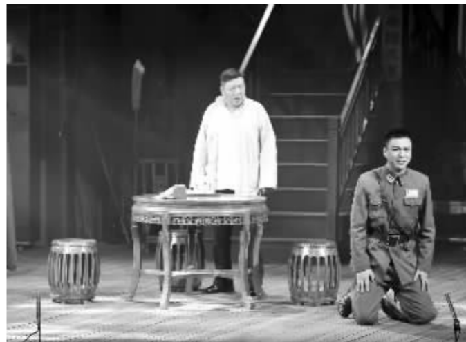
话剧《中山码头》昨晚在江苏省文联艺术剧场首演