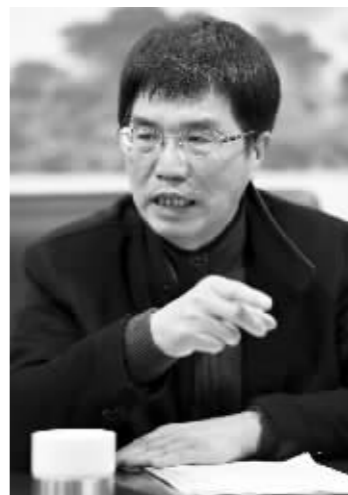
江苏省委宣传部副部长、省文联党组书记章剑华