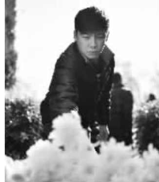
奥运冠军陈玘献花

距离首个国家公祭日还有4天, 各种悼念活动在南京陆续展开。昨天上午近11点, 乒乓球奥运冠军陈玘、女子中长跑名将周春秀等人, 也来到长江边上, 向侵华日军南京大屠杀中山码头遇难同胞纪念碑献花、致哀。