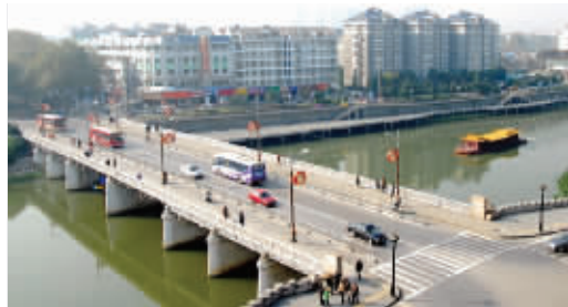
未来设想在长干桥两边各架机动车通道,长干桥或变身步行桥 资料图片

解放门将扩大玄武湖公园入口前的集散广场,增设大巴停车场,扩大服务设施规模以满足大量游客集散的需要。此外,对解放门以西台城墙段落沿线北侧进行慢行系统整治,开放尽端(断头处)城墙登临点,设置公共停车场。还会增设公共厕所、零售小卖、物业管理等。