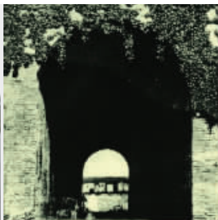
右图:1889年的正阳门 资料图片