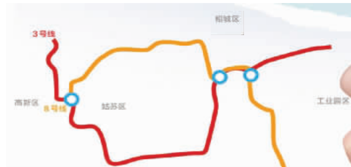
规划中的3号线和8号线 资料图片