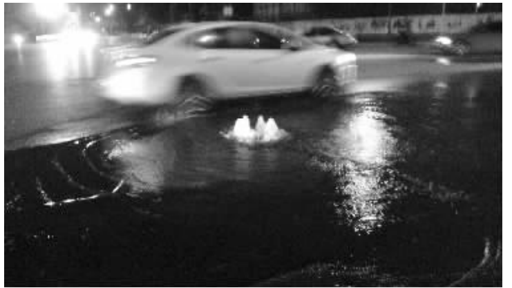
“窨井喷泉”

快报讯(见习记者 欧阳丽蓉) 12月6日晚上7点多,有市民拨打现代快报热线96060称,鼓楼区城河北路与晓街交叉口附近,有十几公分的水柱往外冒,可能是自来水管爆裂。现代快报记者赶到现场发现,水是从窨井里冒出来的。附近居民说,窨井里冒出的其实是污水,已经一年多多了。天气越来越冷,他们担心以后路面结冰,存在安全隐患。