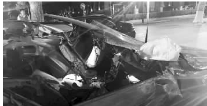
撞击力太猛,轿车顶盖被撕开

快报讯(见习记者 徐萌)昨天凌晨2点多,在秦淮区中华路上,一辆轿车追尾停在快车道卸货的大货车。坐在轿车副驾驶位的女子受伤,前挡风玻璃脱落,顶盖撕开变形。目击者称,肇事女司机直言自己喝了酒,掏钱打算私了。交警部门表示,肇事女司机身上有酒味,但是否酒驾还要抽血检测。