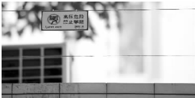
学校围墙上,装了类似高压电网的东西