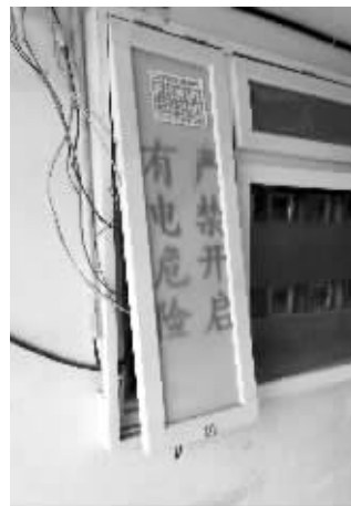
楼道电表箱内接出七八根电线

一位住户称,很多人都这样接电,基本是自己干。一般在电表箱可以接一根火线、一根地线,