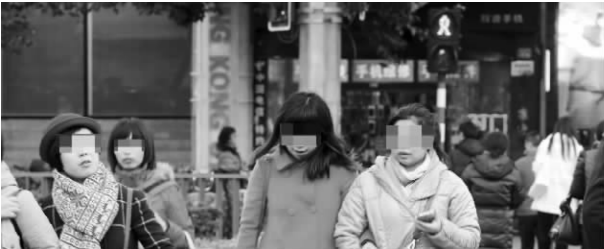
南京洪武路与淮海路路口，闯红灯的行人“络绎不绝”