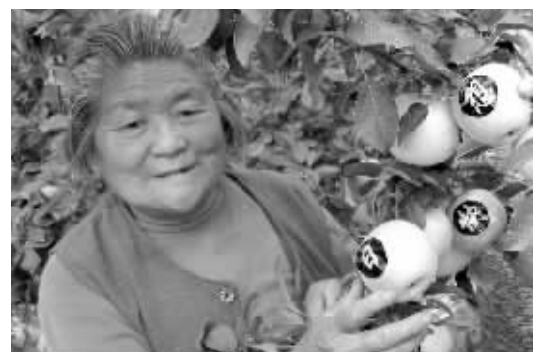
丰县苹果不久将在无锡直销