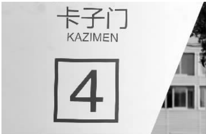
卡子门地铁站站名牌上的“卡”念“kǎ”

对此,现代快报记者咨询了南京地名专家薛光,“虽然我在南京生活了几十年,但我不住在老城南,所以就注意到老城南人是怎么读的,”薛光介绍说,卡子门是个老地名了,因清代收货物税在此设卡得名,所以称为“kazimen”。现泛指雨花东路、卡子门大街、晨光路、雨花南路交汇处及世纪广场周围一带区域。