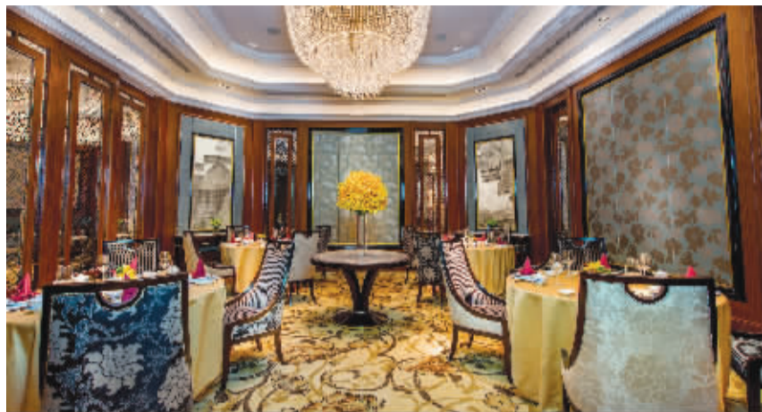
香格里拉江南灶中餐厅

南京香格里拉大酒店宴会和会议场地的规模和设施堪称全市之首,是举办大小会务、各类社交活动和宴会的理想之选。位于三层的盛世堂无柱式大宴会厅面积达2100平方米,可同时容纳1900人的鸡尾酒会或1300人的圆桌宴会,也可分隔为3个独立的区域。酒店二层还设有一间面积达608平方米的南京宴会厅,可容纳550人的鸡尾酒会或是400人的宴会,也可分隔为2个独立的区域。