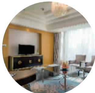
行政套房 - 客厅区

豪华阁贵宾廊位于酒店40层,坐拥玄武湖的湖光山色。无所不能的礼宾管家亲自处理宾客的旅行安排,满足方方面面的要求。每位入住豪华阁楼层的宾客可于豪华阁贵宾廊享用酒店精心准备的早餐、鸡尾酒以及各种小食。