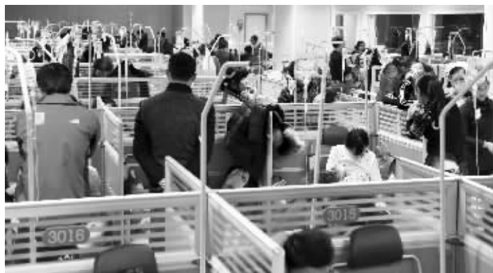
昨晚10点左右,南京儿童医院输液室一片繁忙