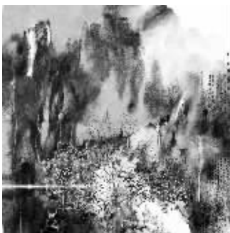
卢禹舜《乾坤大义图14》