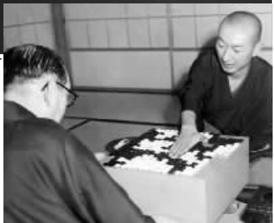
十番棋吴清源(右)对木谷实

先生祝寿,聂卫平等中国围棋界众多知名人士也到场祝贺,王汝南代表中国围棋协会授予吴清源围棋发展杰出贡献奖。 对于吴清源,著名物理学家杨振宁认为,他在围棋界的地位要比爱因斯坦在物理界高。 综合