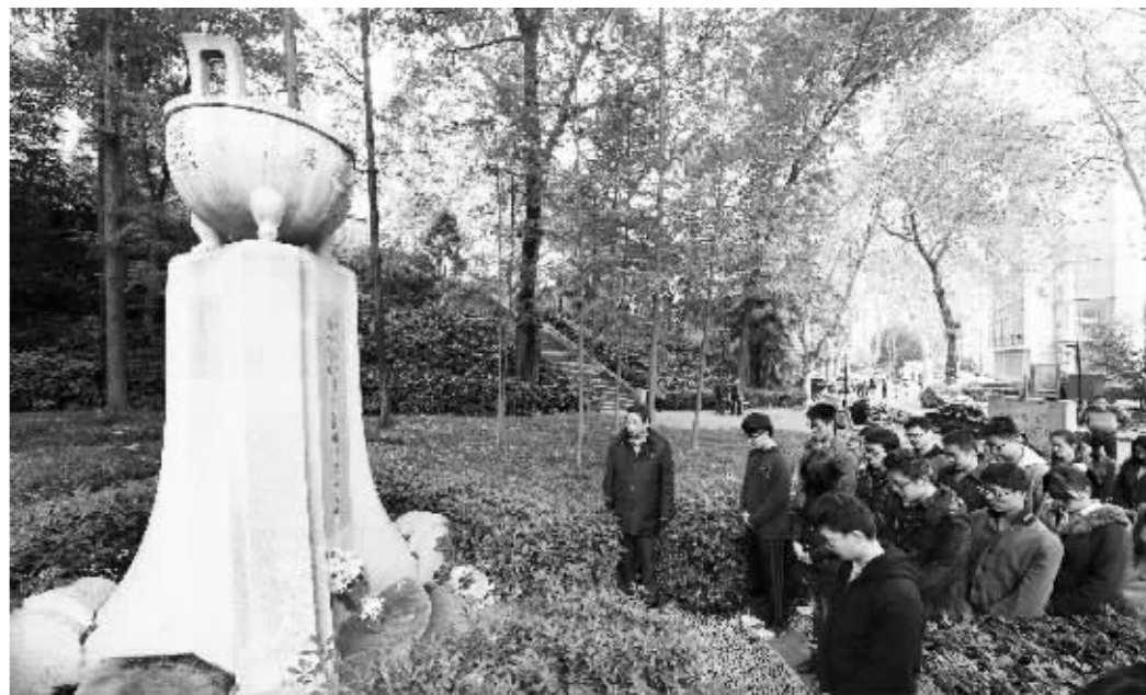
河海大学的学生在清凉山遇难同胞纪念碑前举行默哀仪式

由于是初冬, 纪念碑旁的树叶纷纷落下, 落在台阶上。于是, 于晓飞他们找来扫帚, 把上面的落叶轻轻扫干净。