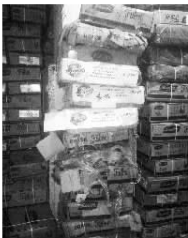
巴西牛肉堆积仓库里

3月5日,专案组决定收网抓捕。专案组抽调40多名警力分赴徐州、灌云以及外省等地实施抓捕,并依法冻结涉案资金3000多万元。当晚7点左右,抓捕组在徐州抓获了7名嫌疑人,在灌云抓获了3名犯罪嫌疑人,查封冰冻巴西进口牛副