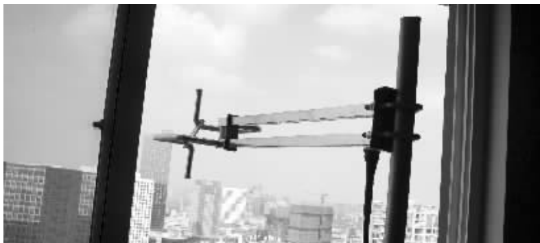
架设在出租屋窗外的“黑广播”发射天线