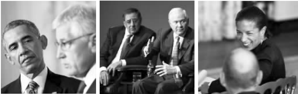
从左至右:奥巴马、前任防长哈格尔、帕内塔、盖茨,美国国家安全顾问苏珊·赖斯