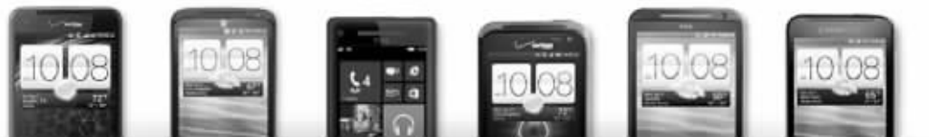
本版均为资料图片