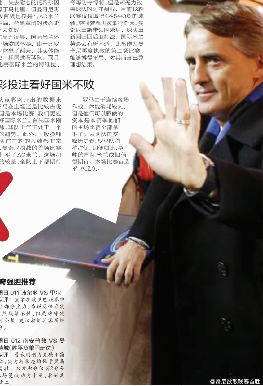
曼奇尼欲取联赛首胜

点评:曼城刚刚力克德甲霸主拜仁,实力与状态均强于黑马南安普敦,双方积分仅有2分差距,本场曼城动力十足,看好其迎头赶上。