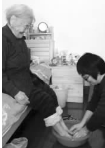
外孙女给外婆洗脚

8年多来,每天的早晨和傍晚路过溧阳人民广场时,都能看到一位女子搀着一位老太太在散步,两人总是有说有笑。认识她们的人都知道,老太太今年101岁高龄,女子是老太太的外孙女,只不过她们没有血缘关系。 王田夫 蒋洪宁 葛小林