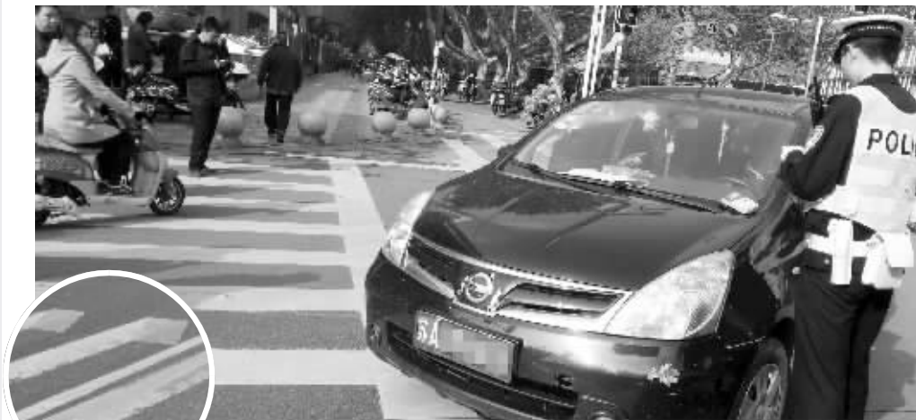
▲南京大多数路段斑马线上有菱形礼让预告标志