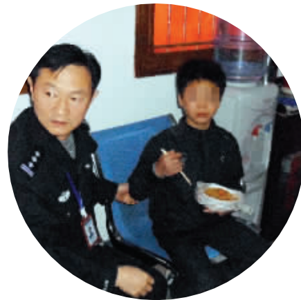
浩浩在派出所