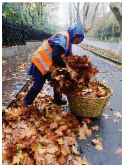
徒手抱起落叶塞进垃圾筐