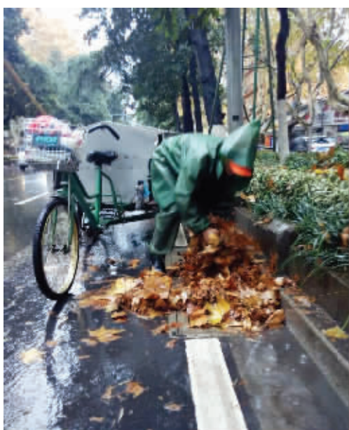
用手指抠落叶