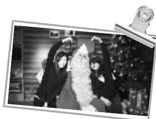
圣诞老人与粉丝合影