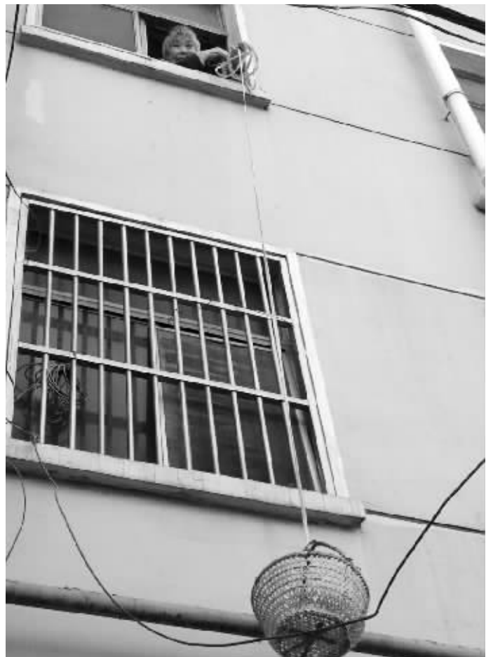
一根长绳和一只竹篮已经成了社区里的风景