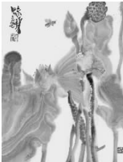
参展作品 周京新《荷塘系列1》