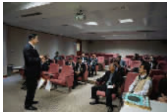
蓝绍敏书记向台湾客商推介泰州

上个星期,泰州市委书记蓝绍敏率团奔赴宝岛台湾,开展经贸交流。短短7天时间,蓝绍敏一行先后拜访和接触了200多名政商界人士。每到一处,蓝绍敏都用自己的切身感受推介泰州的诸多“好”。“康泰之州、富泰之州、祥泰之州”的独特魅力也在台湾工商界迅速传播开来。