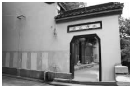
永济寺残存的建筑上有“永济江流”四个字

永济寺是南京著名古刹,“永济江流”曾是著名的清四十八景之一。昨天,现代快报记者从南京市规划局获悉,南京将在滨江风光带的幕燕段重建“永济江流”美景。目前,项目规划设计任务书已完成并发布。