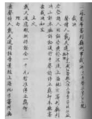
江苏高等审判厅判决