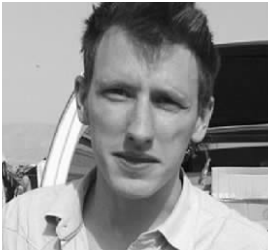
美国人道救援人士卡西格(资料图片)