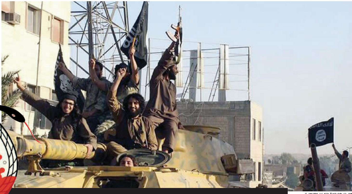
“伊斯兰国”武装分子