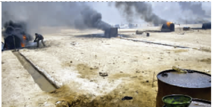
走私石油为“伊斯兰国”带来平均每天250万美元收入

“伊斯兰国”不用担心找不到买主,因为国际市场的原油价格是80美元一桶,而他们平均只卖40美元一桶