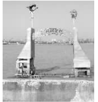
雕塑底座挡板大落分已脱落

“不是刚建好吗?怎么又返工了?”路过市民表示不解。“当时为了赶工程进度,很多细节没有注意到。”下关滨江开发指挥部负责人告诉记者,“江豚观赏地”项目5月份才确定动工,6月份开工,7月份建好,实际建设时间只有一个月。“建设的时候没有考虑到江水的冲击力会这么大,当时正是夏季