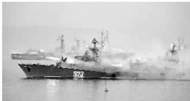
当地时间2014年7月27日,俄罗斯海军日庆祝仪式在符拉迪沃斯克的海军港口举行,俄罗斯海军装备纷纷亮相