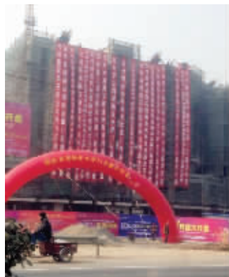
楼盘上的条幅

11月11日，邳州啦呱社区网友拍到当地一家楼盘的开业祝贺条幅十分壮观，近20个条幅中，有一大半来自政府部门。昨天上午，多家部门通过媒体、网络发声澄清，称条幅为开发公司擅自冒用政府部门名义悬挂。当日，该开发公司回应是广告公司的行为，条幅已被取下。