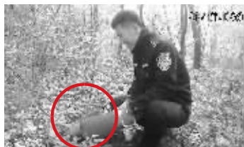
民警将刺猬放归山林

本报讯(通讯员 秦公轩 鲁斌山 记者 陶维洲)面对两只抱团取暖的刺猬,姚女士抓也不是,推它滚走也不是。这是近日发生在南京一居民家里的真实一幕。秦淮警方接到报警后,上门将两只“大秀恩爱”的刺猬“夫妻”放归山林。