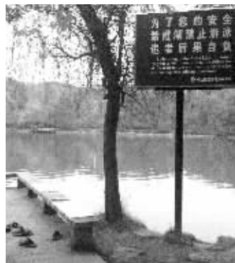
禁止游泳牌子下面就有一些下水游泳者的拖鞋

对此,景区一位工作人员表示,从管理上来说,紫霞湖是禁止游泳的,四周也设立了警示牌,但总有些市民下水,“拦都拦不住。”