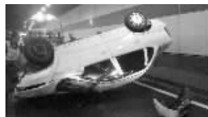
小轿车底朝天躺在隧道内

本报讯(见习记者 陈曦)11月11日晚上约9点,有市民向现代快报热线96060反映,九华山隧道由北向南方向,一辆轿车翻了。