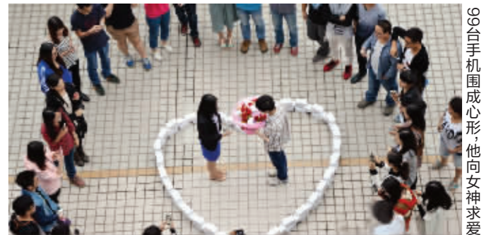
99台手机围成心形,他向女神求爱

近日,广州某游戏公司程序员为了赶在双十一“光棍节”前“脱单”,竟买来99台iPhone6在公司楼下摆成心形,扎成花束高调表白,声称要送女生“最有分量的爱”。昨天,求爱男生的同事@宅二世阿萌在微信上回应称,男程序员是他同事,99台iPhone6是攒钱托亲友买的,很不容易。女生至今没有答应,原因很复杂。99台iPhone 6是退不掉了,也不知道怎么处理,也没做黄牛。综合