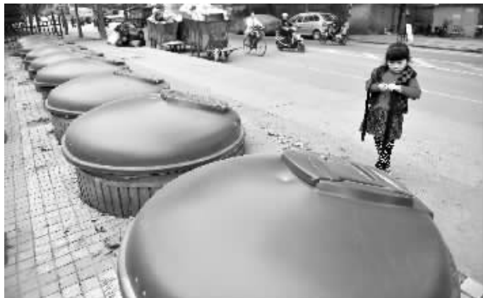
南京市秦淮区酒精厂路10个地理式垃圾桶