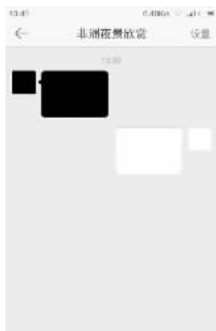
“南极雪景欣赏”和“非洲夜景欣赏”交流摄影心得