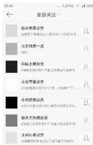
一系列冲击灵魂的摄影微博

微博里,过阵子就会冒出一批令人眼球的账号,还记得微博账号“古城钟楼”吗?它以西安钟楼为背景,从2011年10月26日起,坚持每天按干支计时的十二时辰定时发送“铛铛”的微博报时。一时间,报时账号火爆微博。最近,网友“韩饭桶”发现了一个好玩的摄影名博,账号是“北极雪景欣赏”,点进去一看,“我的世界再一次雪崩了!”