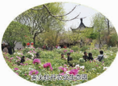
黄尖牡丹农业生态园