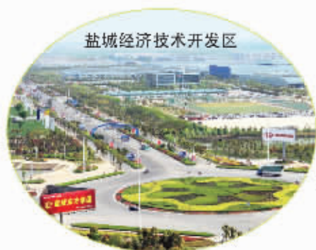
盐城经济技术开发区