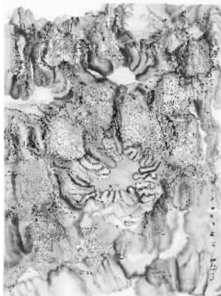
邱志杰《我不逃离这个世界》130cmX97cm 纸本水墨 2014