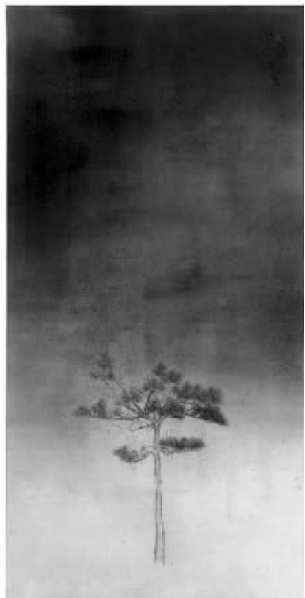
朱建忠《影迹III》138cm x 68cm 纸本水墨 2014