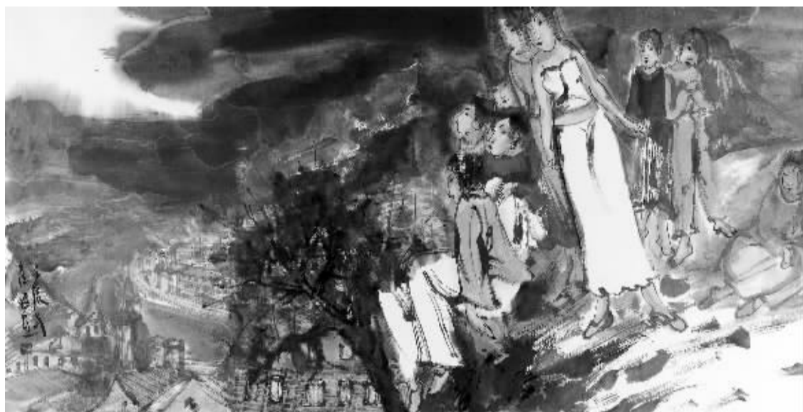
崔进《冷雨》纸本设色 136cmX68cm 2012