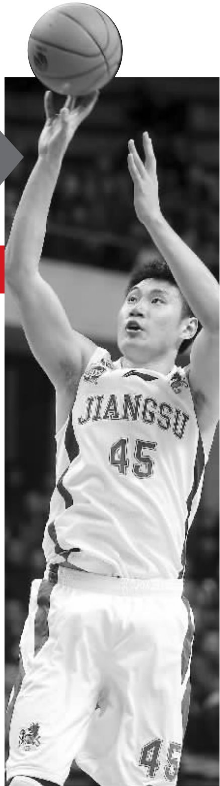
中天队上座率不错